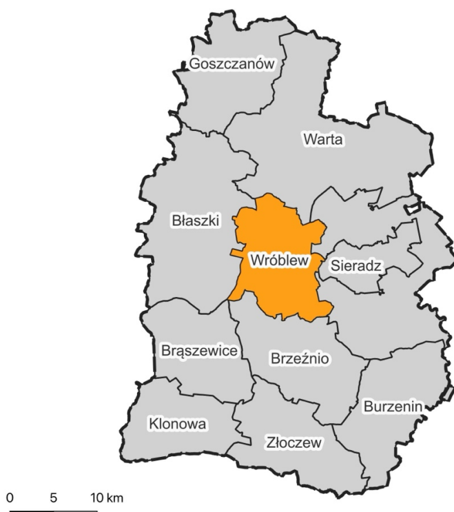
Rys. 1. Lokalizacja gminy na tle powiatu sieradzkiego

Dominującą formę pokrycia i użytkowania terenu stanowią użytki rolne (ok. 83,8% powierzchni Gminy) oraz lasy (ok. 8,8% powierzchni Gminy). Według danych GUS za 2024 rok Gminę Wróblew zamieszkiwało 5878 osób. W tym samym czasie gęstość zaludnienia na terenie analizowanej jednostki wynosiła 51,2 os./km 2 . Gęstość zaludnienia gminy Wróblew jest dość stabilna i mieści się w zakresie 52-58 os./km 2 , niemniej jednak jest gminą o mniejszym zaludnieniu w porównaniu do średniej powiatu sieradzkiego, czy województwa łódzkiego.