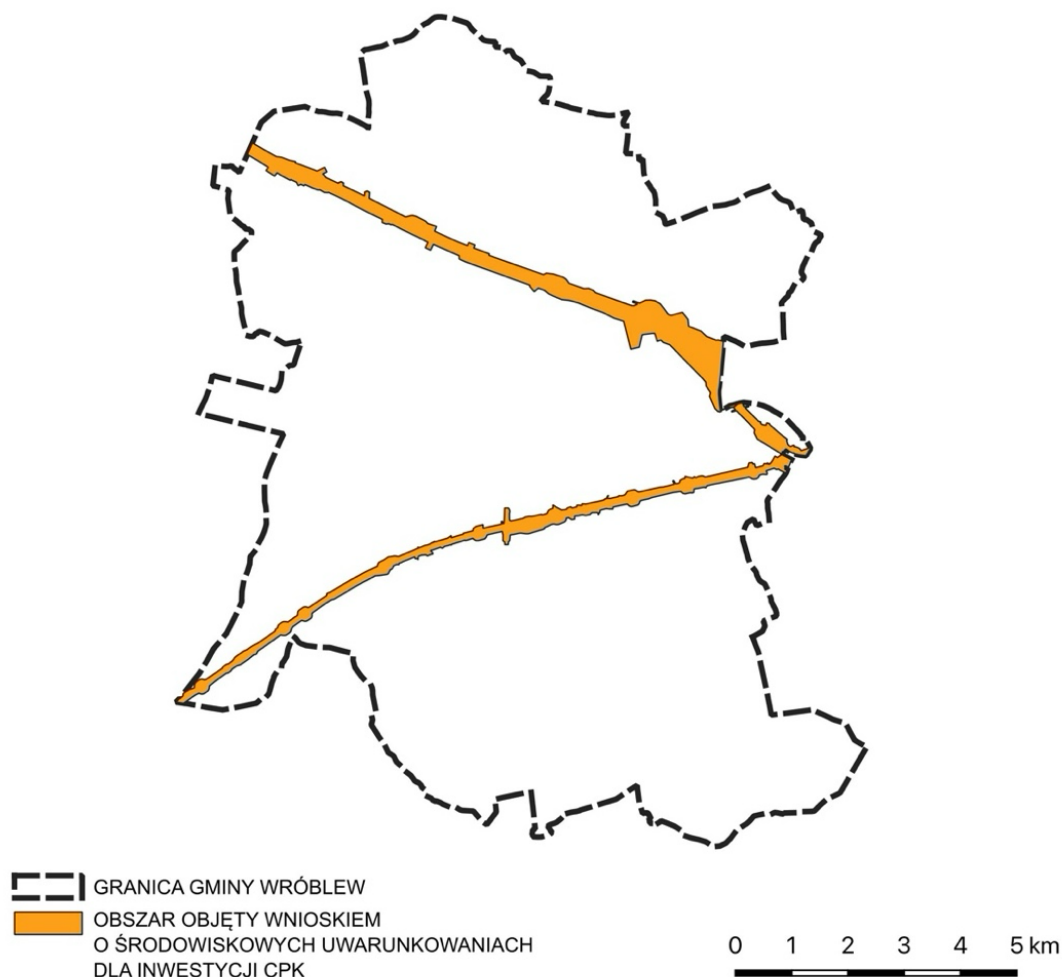
Rys. 1. Lokalizacja obszarów przewidzianych w DŚU pod inwestycje kolei dużych prędkości.

Przez teren Gminy Wróblew planowany jest przebieg linii kolejowej 85 Sieradz – Kalisz – Pleszew – Poznań oraz linii 86 Sieradz – Kępno - Wrocław, które są istotnym elementem największego w Europie Środkowo-Wschodniej, wieloletniego programu inwestycyjnego i komunikacyjnego – Centralnego Portu Komunikacyjnego.