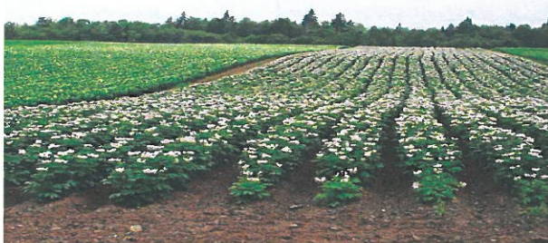
Fot. Pola uprawne.

Zgodnie z danymi z CEiDG w sołectwie Wróblew w roku 2016 zarejestrowało działalność gospodarczą 32 przedsiębiorców. Aktywność ta koncentruje się głównie w zakresie rozwoju usług handlowych, krawieckich, fryzjerskich oraz hodowli drobiu, przetwórstwa i budownictwa. Główną dziedziną, w której specjalizują się mieszkańcy Sołectwa to rolnictwo. Bardzo urodzajne gleby oraz wysoka kultura rolna sprawiły, że rolnictwo jest podstawą gospodarki Sołectwa. Na jej terenie przeważają gleby klasy II, III i IV. Potencjał wsi stanowią użytki rolne, które utrzymywane są w wysokiej kulturze rolnej, odwdzięczając się rolnikom dorodnymi zbiorami. Miejscowi rolnicy specjalizują się głównie w uprawie ziemniaków na wczesny zbiór oraz zbóż. Wyższa produkcja towarowa, rozwinięte przechowalnictwo, wysokie wyposażenie gospodarstw i możliwości transportowe stanowią poważną ofertę dla przetwórstwa rolno-spożywczego i zaopatrzenia.