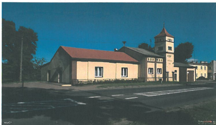
Fot. Remiza strażacka we Wróblewie.

Zgodnie ze statutem sołectwa organem uchwałodawczym i kontrolnym dla sołectwa Wróblew jest Zebranie Wiejskie, natomiast interesy mieszkańców wobec organów Gminy reprezentuje Sołtys wspomagany przez Radę Sołecką. Przedstawiciele mieszkańców Sołectwa zgłaszają do organów Gminy wnioski oraz projekty przedsięwzięć i inwestycji. Zdecydowana większość mieszkańców interesuje się tym, co się dzieje w gminie, regionie. W Sołectwie działa Ochotnicza Straż Pożarna, która znajduje się w Krajowym Rejestrze Ratowniczo-Gaśniczym. Miejscem, w którym organizowane jest życie kulturalne i rozrywkowe mieszkańców Sołectwa, jest obecnie remiza strażacka.